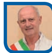
Enzo Canepa Sindaco di Alassio

Auguro a tutti i partecipanti una fruttuosa partecipazione ed un piacevole soggiorno con la certezza che la Città del Muretto non vi deluderà.