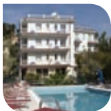
HOTEL GARDEN*** Telefono: 0182/470318 info@hotelgarden-alassio.it

CAMERA HOTEL 3 STELLE (colazione esclusa) Camera singola € 90 - Camera doppia € 130