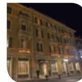
HOTEL DEI FIORI*** Telefono: 0182/640519 info@hoteldeifiori-alassio.it

CAMERA HOTEL 4 STELLE (colazione esclusa) - Camera singola € 130 - Camera doppia € 170